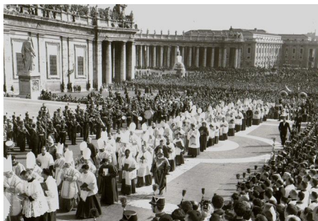
Imagen 3. Ceremonia de apertura del Concilio Vaticano II 10

Este fenómeno músico-social de la canción de autor tuvo también su proceso paralelo entre artistas creyentes vinculados y comprometidos con la Iglesia. El Concilio Vaticano II 9 (Imagen 3) supuso un nuevo amanecer para la música católica, en general, y para la española, más en particular. La incorporación de la lengua vernácula al culto oficial, la aceptación de nueva instrumentación – junto con el tradicional y sempiterno órgano de tubos – y la participación de los fieles en el canto, grosso modo , supusieron una auténtica revolución musical católica que, todavía hoy, sigue su cauce. Al calor de los nuevos cambios nacieron cantautores y grupos que dieron un nuevo giro a la realidad musical católica española.