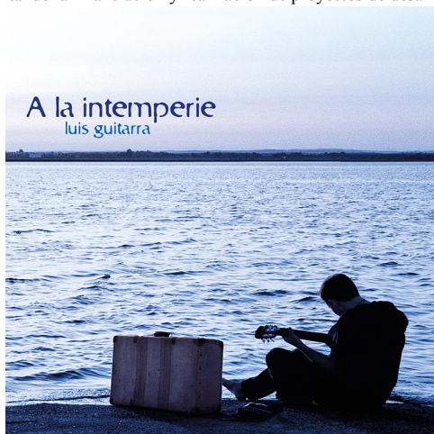
Imagen4. Portada de A la intemperie de Luis Guitarra 13

Luis Martín – conocido artísticamente como Luis Guitarra – es un cantautor madrileño nacido en 1968, perteneciente a la generación de cantautores que se da a conocer a mediados de los años noventa del siglo XX. Fue además uno de los precursores de un sistema alternativo de distribución denominado “El precio lo pones tú” 12 , que ha conseguido aunar música y solidaridad, posibilitando la financiación y realización de proyectos de desarrollo humano.