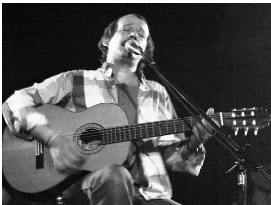
Imagen 2. Silvio Rodríguez en concierto 8